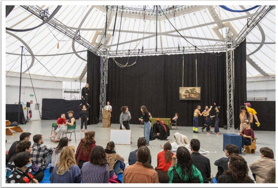
Pista Oberta al CACRR, desembre 2022

Podem dir que al llarg d'un any, milers de persones, s'acosten per primera vegada a aquest art escènic, gaudeixen o amplien el seu coneixement sobre el circ. En aquesta tasca es primordial l'aliança amb equipaments i agents culturals de tota la ciutat. Enfortir les relacions amb aquests agents possibilitarà la creació de nous públics al voltant de tota la ciutat.